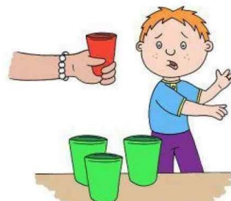
Неумение или нежелание приспосабливаться к изменениям