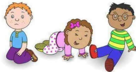
Неумение находить общий язык с другими людьми