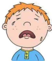
Смех или плач без причины