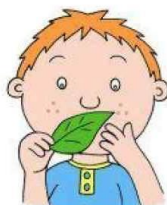
Странное отношение к предметам

Registered Charity No: 1148010 Support when you need it the most. www.autismpuzzles.co.uk Tel: 07971 045128