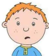
Отсутствие речи или её слабое развитие