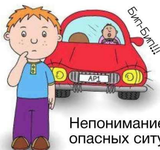
Непонимание опасных ситуаций