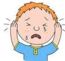
Гиперчувствительность или слабая чувствительность к посторонним звукам