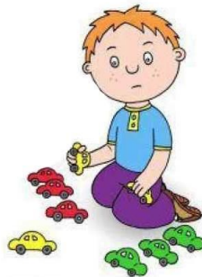
Использование игрушек не по назначению